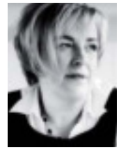
di Tiziana Colombo

S ecundo i dati dell'Istituto superiore di sanità, circa l'8% dei bambini e il 2% della popolazione adulta, soffre di "reazioni avverse ad uno o più cibi" che si manifestano con sintomi gastrointestinali: dolori addominali, crampi, diarrea, e vomito. Oggi 7 italiani su 10 non digeriscono il lattosio, mentre un italiano su cento soffre di celiachia.