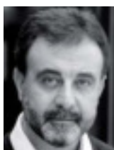
di Giuseppe Di Fede

I l latte è un componente fondamentale della dieta dei Paesi occidentali e la sua tollerabilità da parte dei diversi individui non è assoluta. Alcuni soggetti suscettibili dopo l'introduzione di latte, in forme diverse, lamentano la comparsa di sintomi addominali che scompaiono con l'astensione dall'assunzione dell'alimento stesso. Il 70% della popolazione mondiale circa ne sarebbe interessato.